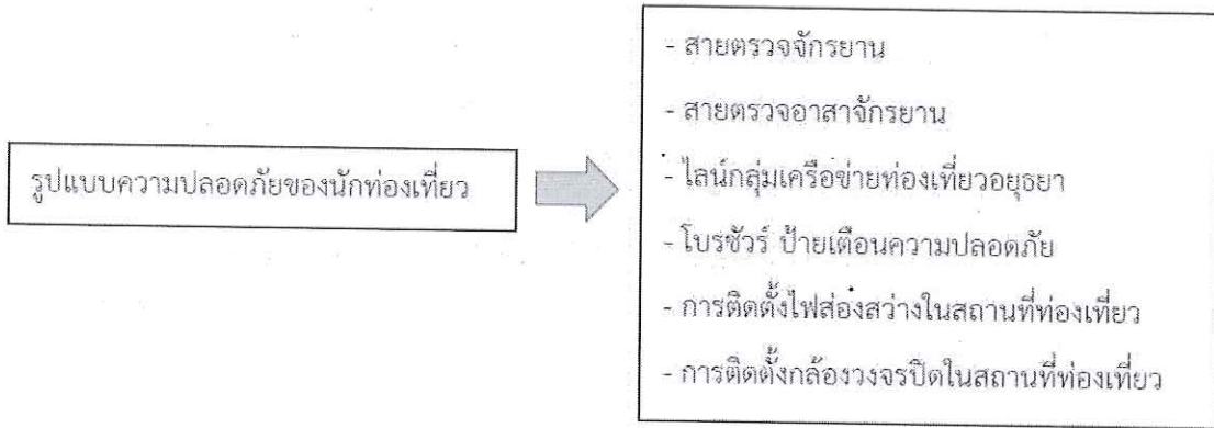
แผนภาพที่ 1 รูปแบบความปลอดภัยของนักท่องเที่ยว

จากการวิจัยสามารถสรุปผลการศึกษาโครงการความปลอดภัยของนักท่องเที่ยวในการท่องเที่ยว ในจังหวัดพระนครศรีอยุธยา ตามวัตถุประสงค์การวิจัย ได้ดังนี้